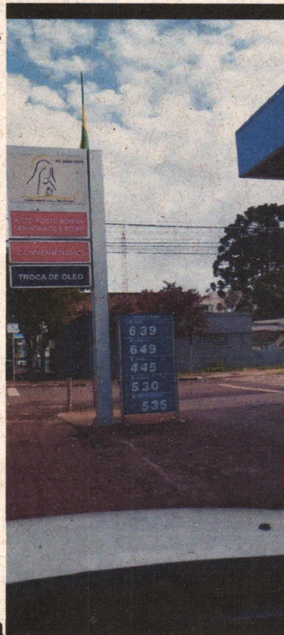
Auto Posto N. S de Fátima