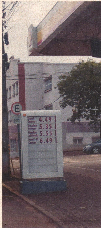
Auto Posto Oeste