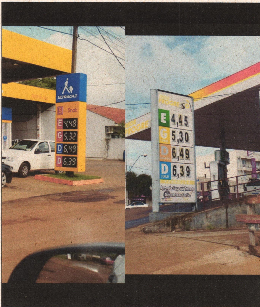
Auto Posto Progresso